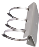
DS-1275ZJ Крепление на столб