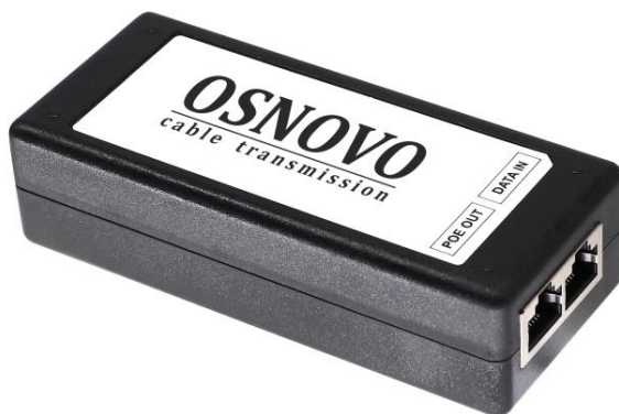
Рис.1 Midspan-1/300G, Midspan-1/300GA, внешний вид